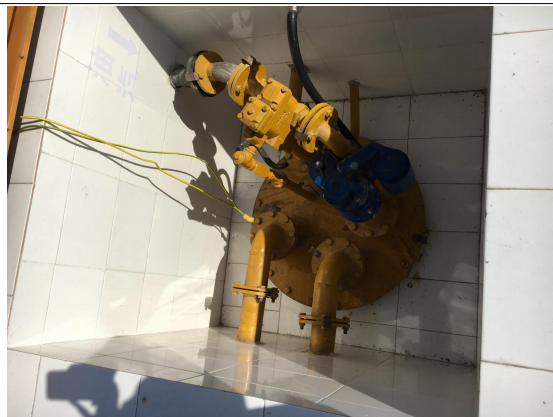
项目区油气回收系统