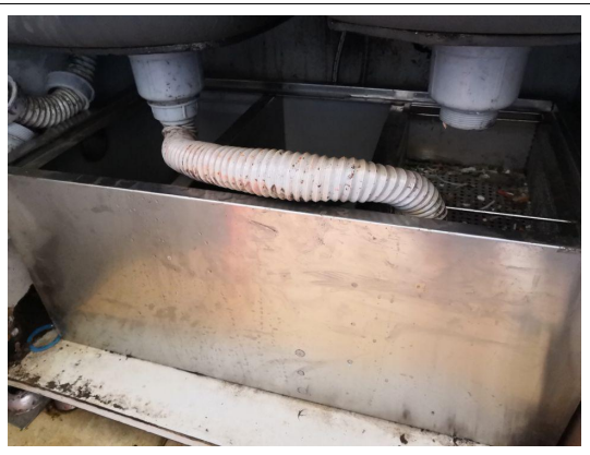
项目区厨房隔油池