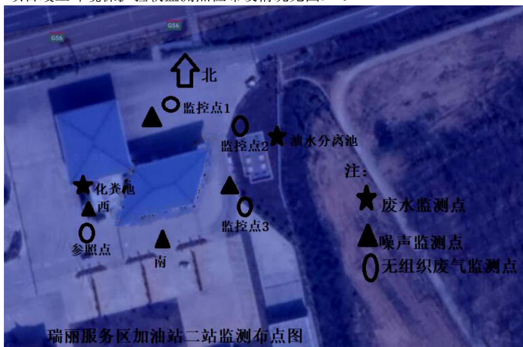
图3-1 监测点位布置图