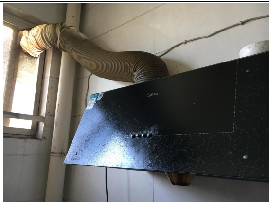
项目区厨房抽油烟机