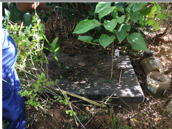
项目区油水分离池